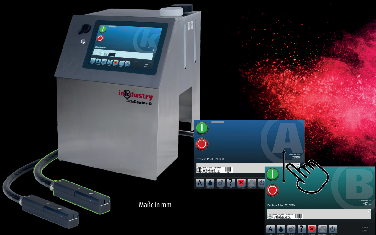
Maße in mm